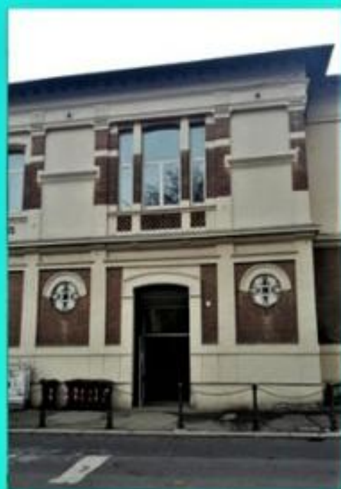
E. De Amicis